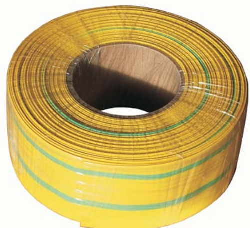
balení 25, 50, 100, 200m

Vysvětlivky použitých zkratk v tabulkách: